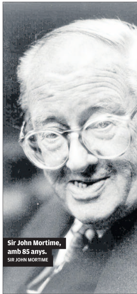
Sir John Mortimer, amb 85 anys. SIR JOHN MORTIMER

Per aquestes trames entren i ixen, amb ofici i estudiats moviments, tot un seguit de personatges secundaris ben identificables i alhora amb algun traç sorprenent. Com una malcriada nobiliària que descobreix la política i la rebel·lia al mateix temps i que ha passat, en un breu període, de l'opulència refinada a menjar fish and chips amb les