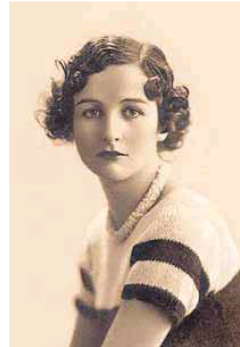
BELLA. Nancy Mitford.

'Trifulca a la vista' (en inglés 'Wigs on the green'), que se presenta con una impecable traducción de Patri-