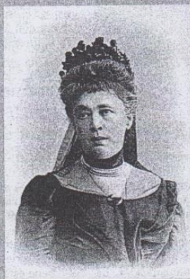
Bertha von Suttner

Hace unas semanas la excelente colección Letras Universales, de Editorial Cátedra, ha puesto en librería una nueva edición, a cargo de Olga García, de otro de esos "libros que mueven conciencias". Se trata de Abajo las armas! de la baronesa Bertha von Suttner, publicada en 1889 con una tirada inicial de 1.000 ejemplares, rápidamente reeditada hasta agotar, con el siglo, las cuarenta ediciones, y pronto traducida a veinte lenguas: el gran best seller europeo de la última década del XIX. Se trata de la memoria novelada de una mujer de la aristocracia austriaca que ve (y sufre) cómo su país se enzarza, entre 1859 y 1871,