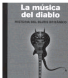
La música del diablo

Este es un libro escrito con la urgencia del manifiesto, y la reflexividad del ensayo, con la cercanía sincera de las mejores autobiografías y con la distancia necesaria del pensamiento crítico. Es un libro escrito por un agricultor y filósofo autodidacta que se ha convertido en uno de los referentes del pensamiento más lúcido.