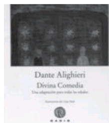
Divina Comedia. Una adaptación para todas las edades

Este libro está dedicado a los músicos que con su valiente aportación dieron nueva vida a un maravilloso movimiento, el blues, que estaba prácticamente muerto en la tierra que lo vio nacer, América. Domenech traza la apasionada historia de la creación del Blues Británico.