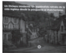
Un paraíso inalcanzable

AUTOR: John Mortimer TRADUCCIÓN: Magdalena Palmer GENERO: Novela EDITORIAL: Libros del Asteroide EDICIÓN: Barcelona, 2013 PÁGINAS: 447 PRECIO: 22,95 euros