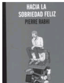
Hacia la sobriedad feliz

No me gustan (no gustan en general) las novelas de tesis, pero hay que señalar la calidad de este texto. No es extraño, por tanto, que haya conocido innumerables ediciones y que continúen apareciendo estudios de especialistas: también se hicieron dos películas en tiempos del franquismo, dirigidas por José Luis Saenz de Heredia (con Armando Calvo y Mercedes Vecino) y por Javier Setó (con Spartaco Santoni y Mara Cruz).