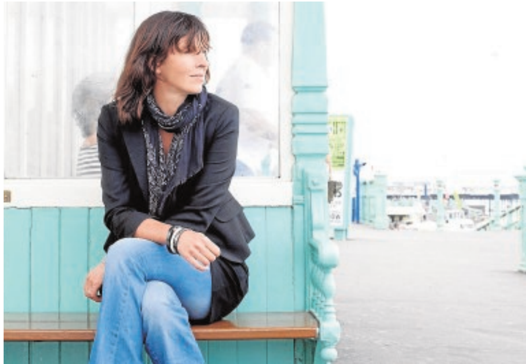
Rachel Cusk está afincada en Reino Unido

Hasta entonces novelista bien considerada y descendiente más o menos lateral de Iris Murdoch y de la poderosa literatura «de/por mujeres» y maliciosamente satírica de la posguerra inglesa, Cusk (Toronto, 1967) decidió poner no manos sino vida a la obra y convertirse en más o menos fiel personaje de sí misma. Así, Cusk publicó tres memorias nada complacientes. En A Life Work: On Becoming a Mother (2001) se exhibió acerca de los horrores y frustraciones y arrepentimientos de haber sucumbido al canto de sirenas y donde la figura paterna es casi invisible. En The Last Supper: A Holiday in Italy (2009), unas vacaciones que se suponían paradisiacas se convierten en el infernal purgatorio y retrato de «lo extranjero» (incluyendo a vecinos del verano que se sintieron violentados por su retrato sin autorización y obligaron a Faber and Faber a convertir en pulpa toda la edición). Despojos: Sobre el matrimonio y la separación (2012) cerró el círculo y avivó las llamas funcionando como el cierre natural del ciclo: si no estás cómo