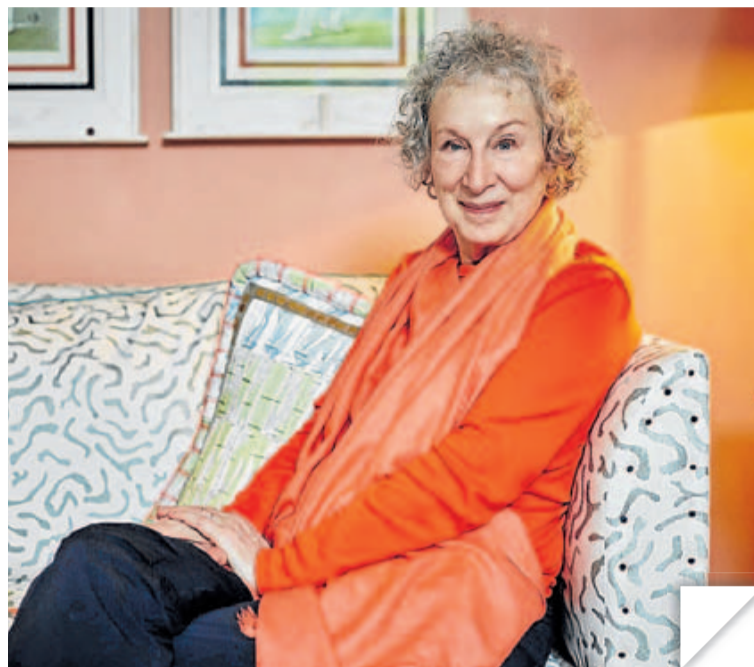
La escritora canadiense Margaret Atwood.

brantes y sus resbalones casi inevitables. Pese a su presupuesto estimulante, no funciona por ejemplo 'La entrevista post mortem', un relato en el que la propia Atwood contacta a través de una médium con George Orwell. Tampoco lo hace 'La metempsicosis o el viaje del alma', cuyo protagonista es un caracol que adopta la forma humana de una mu-