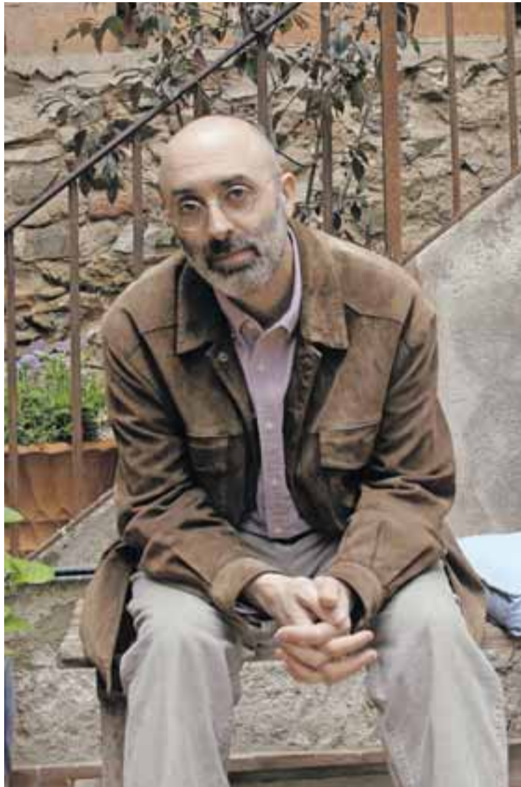
El escritor Eduardo Halfon.

El nacimiento de su hijo es el desencadenante de la escritura en Un hijo cualquiera : "estuve ahí las siete horas que duró el parto de mi hijo. Lo vi entrar al mundo. Oí su primer grito. Sentí en mis dedos su primera respiración". Desde esa experiencia, habla en este libro de distintos momentos de su vida. El relato es emotivo, a veces divertido y a veces melancólico. La literatura de Halfon evita lo grandioso; se centra en anécdotas reveladoras; es concisa y sugerente. Es autobiográfica, pero trasciende el carácter individual. Su historia se convierte en imagen del comportamiento humano: el aprendizaje al que to-