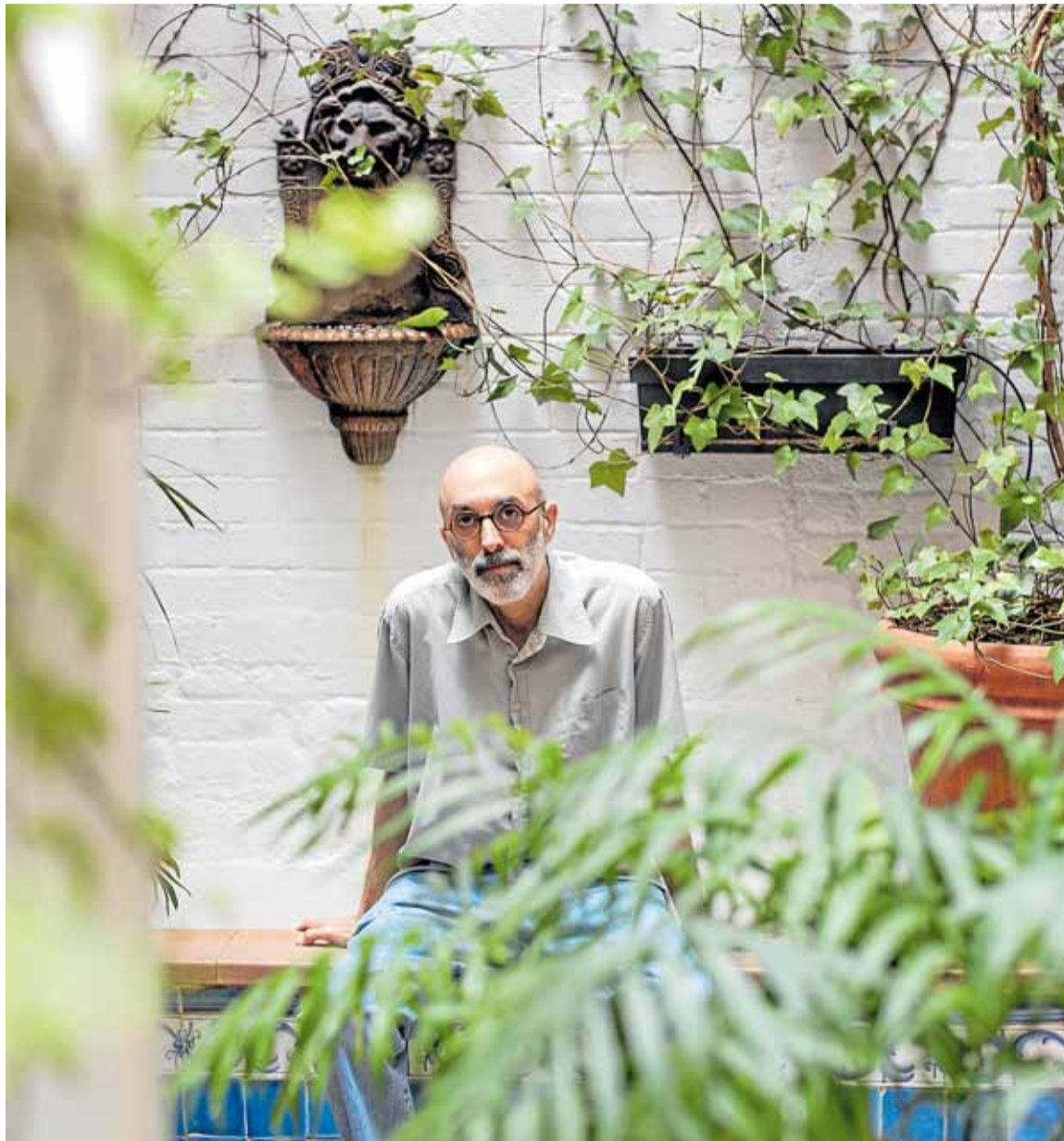
Eduardo Halfon es uno de los escritores más destacados de su generación.

Otro de los aspectos habituales en esta serie de libros de Eduardo Halfon, que con 'Tarántula' suma