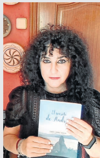
EL SECRETO DE ANDREA ISABEL RAMOS BREIJO Círculo Rojo / 15 euros

Con “El secreto de Andrea”, la autora aborda varias cuestiones en las que es muy fácil verse reconocido: el paisaje del Ortegal, que en este libro tiene personalidad propia, la dualidad entre lo urbano y lo rural y las segundas oportunidades, aunque no se busquen. Estamos, pues, ante una novela de debut que, como todos los estrenos, tiene margen de mejora, aunque el resultado es prometedor y augura éxitos futuros a su autora. (X.F.)