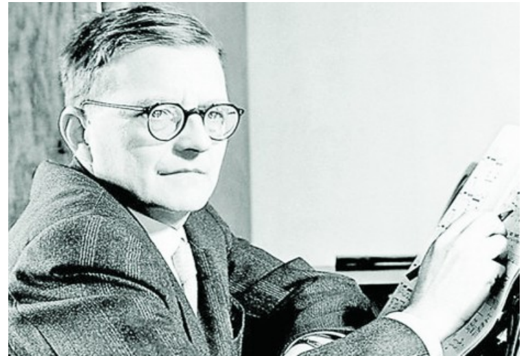
Shostakóvich, un autor entre la lealtad a la URSS y la disidencia

prodigiosa y el alma de un pueblo que durante siglos se ha movido a golpe de corneta desde el feudalismo y la sociedad zarista hasta la dictadura del régimen soviético». En un recorrido por la música rusa, acaso sea el período soviético y la época de Stalin la etapa que mejor define la situación del artista caminando por el filo de la navaja de forzada adhesiones y peligrosas disidencias. Son emblemáticos los casos de Stra-