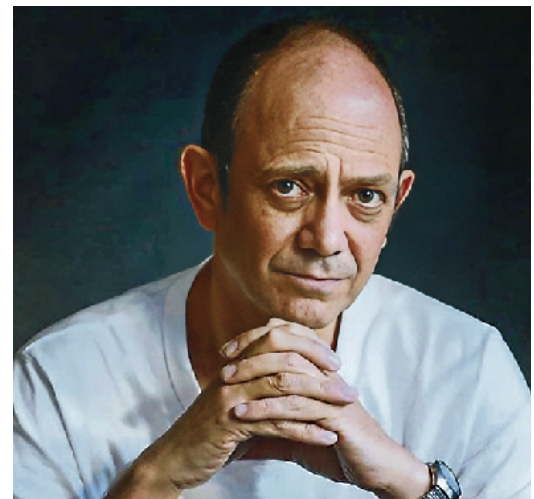
Damon Galgut fue finalista del Booker de 2010 con esta novela

del caminante va lanzando un poco al vuelo es más bien sombrío. No puede evitarlo. Le preocupa esa "nueva sensación" "de que nunca ha vivido de otro modo y que jamás echará raíces". Y sí, puede que su protagonista cambie con frecuencia de país, pero está más cerca del turista que