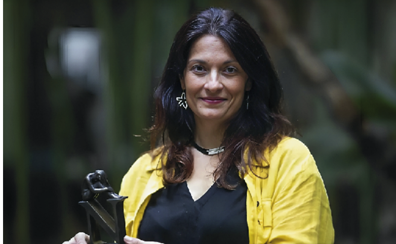
Aunque el rumano es su lengua materna, Oproae escribe en español

Es este un libro sobre el duelo, los silencios obligados y los tabúes impuestos, protagonizado por una niña de unos siete años encerrada en sí misma –no le faltan motivos para la tristeza– que se vale de su imaginación para evadirse de un entorno medio dickensiano. Literalmente atrincherada en un castillo de libros que ha levantado bajo la mesa