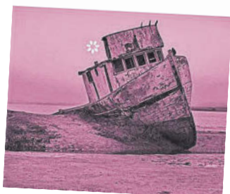
PEDRO MAIRAL El año del desierto Editorial: Libros del Asteroide Precio: 20,95€