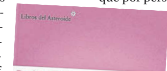
Pedro Mairal El año del desierto