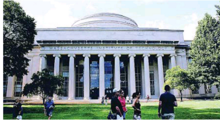
El Instituto de Tecnología de Massachusetts protagoniza la obra del escritor

Esta vez, sin embargo, el pretexto histórico es ajustado, pues Matthew Pearl parte de la creación del MIT, el Instituto de Tecnología de Massachusetts, justo al acabar la Guerra Civil, el auge de la ciencia aplicada y el entusiasmo de los nuevos inventos. Es un tiempo convulso, que Pearl relata con la pasión de quien conoce la historia y los conflictos que el maquinismo y las nuevas tecnologías tuvieron que librar con los luditas, las supersticiones científicas y el odio que de inmediato generó entre las élites de Harvard, al admitir en el MIT a una mujer y becados de la clase trabajadora. Los argumentos a favor y en contra de la creación del