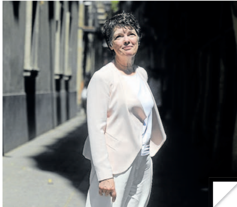
McDermott recrea el ambiente de los expatriados en Vietnam. I. BAUCCELLS

El libro se vertebra a partir de la relación entre Patricia y Charlene, otra esposa destinada en